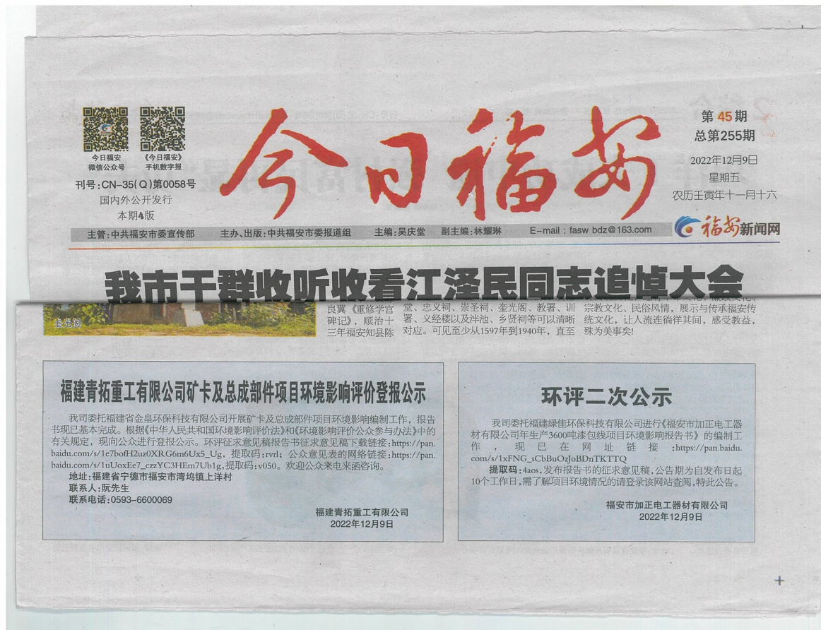
图 3.2-4 征求意见稿报刊公示内容截图