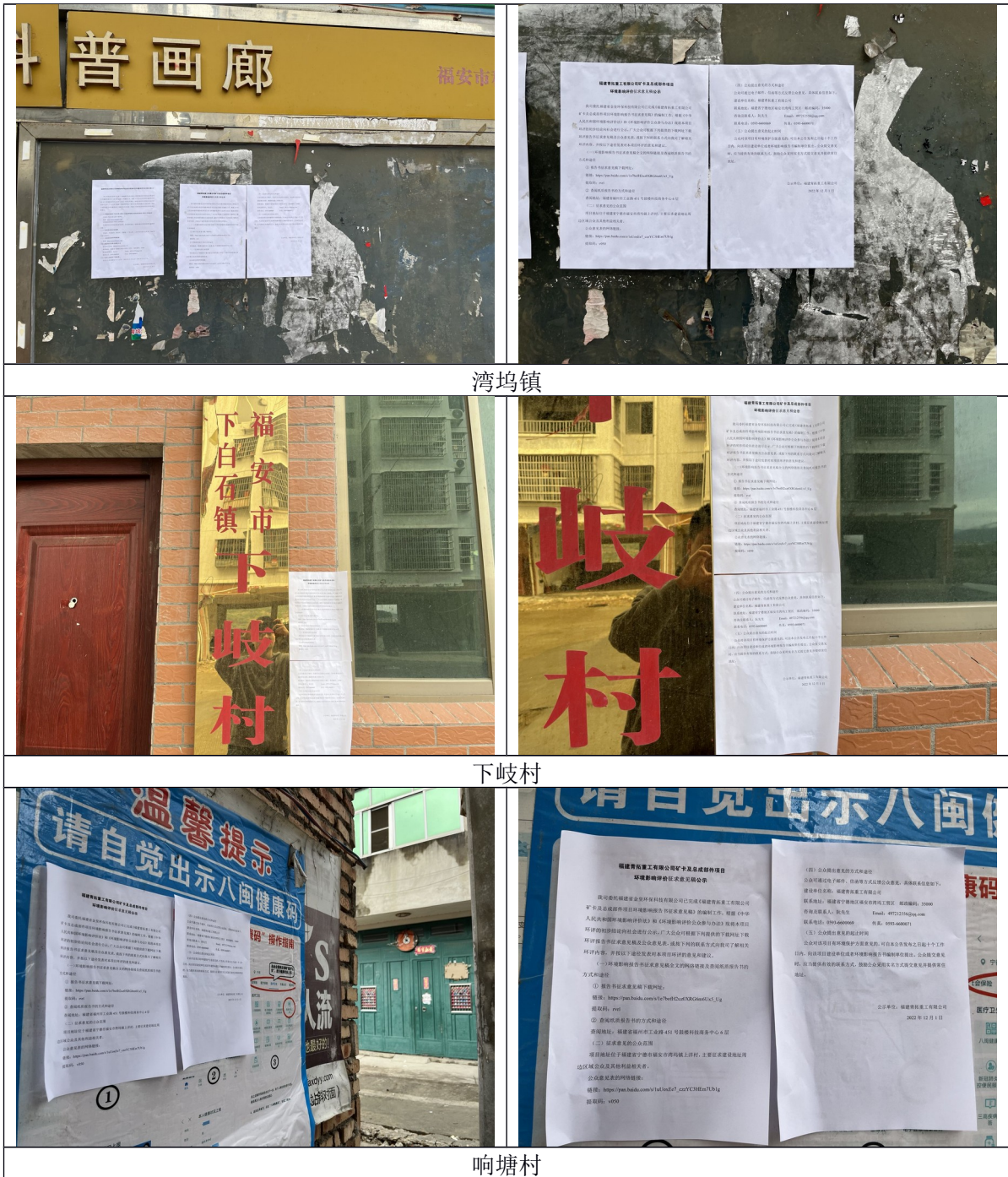
图 3.2-2 张贴公告现场